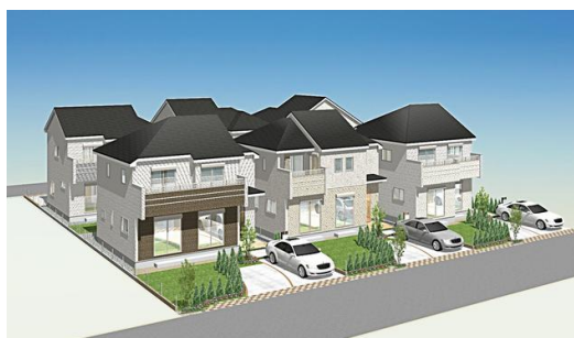
第2期 完成イメージ