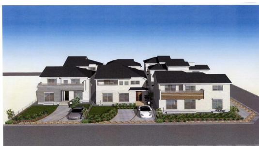
第1期 完成イメージ